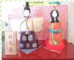
あかりをつけましょ ♪ ぼんぼりに〜♪

3月といえばひな祭り、桃の節句とも言いますね。雛人形を飾り、女の子の健やかな成長と健康を願って祝う伝統行事です。災いをかわりに引き受けてくれる「流し雛」が由来ともいわれています。いたただきものの本格的な日本人形やデイスーツで入居者様が作られた可愛らしいひな人形を玄関に飾りました。今年はおもうひとつ立体カードの小さなひな壇も仲間に加わりました。3人官女もいて愛らしいです。