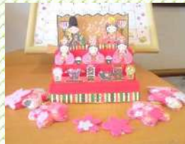
お花をあげましょ ♪ もものはな〜♪