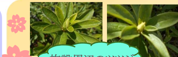
施設周辺のツツジ

本社より、豪華な蘭が届きました。背が高く、とても立派な蘭です。事務所に置かせていただいて、入居者様に楽しんでいただいています。お花が好きな方が多いので、ニコニコと嬉しそうに眺めていらっしゃる姿をよく拝見します。